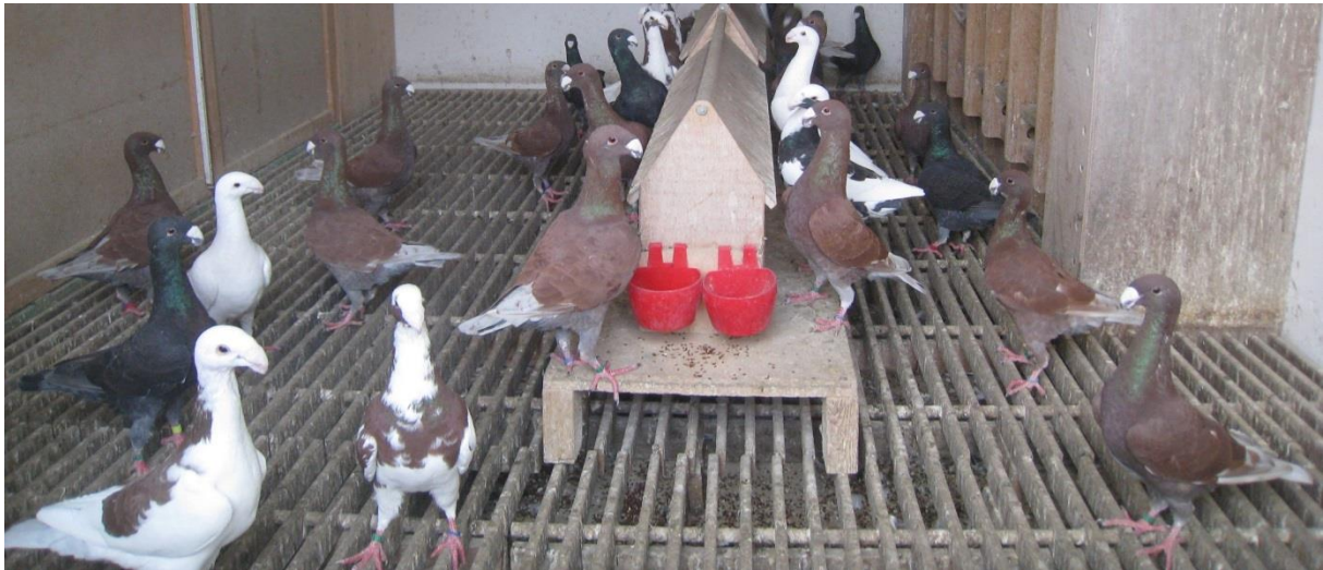
Deutsche Schautauben in Dunkel, Dominant Rot, Gescheckt und Weiß am Futternapf.

Den Grundstein aber bilden die Zuchttiere, die sorgfältig mit viel Übersicht und genauso viel Fingerspitzengefühl ausgewählt werden.