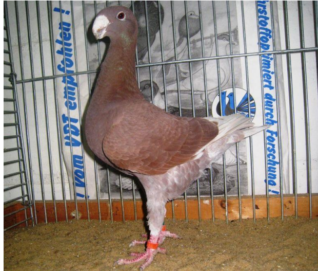
0,1-2013 Dominant Rot 1 x V 97 Leipzig

Eine Arbeit die aber nicht viel Platz für Freizeit lässt und daher ist es wichtig, dass er sich auf seine Familie verlassen kann, ohne diesen familiären Zusammenhalt gepaart mit einem gut durchdachten Schlagmanagement ist es nur möglich solche Leistungen zu erbringen.